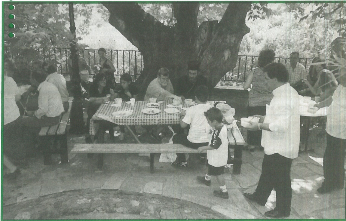
Κάτω από τον πλάτανο, δίπλα από τη Βρύση, στο «ΠΑΥΣΙΑΥΠΟ» της Αγίας Παρασκευής, η παραδοσιακή φασολάδα, οι Καϊτσιώτικες πίτες και ο ζυμωτό ψωμί αποτελούν τη βιτρίνα των εκδηλώσεων και τον πόλο προσέλκυσης επισκεπτών στο χωριό μας

Ολα τα μέλη του Δ.Σ. εξέφρασαν την αγωνία τους για την τύχη των εκδηλώσεων του χωριού μας και την ανάγκη συνέχισης αυτών στο μέλλον και συμφώνησαν να βοηθήσουν όλοι προς την κατεύθυνση αυτή, καθ' όσον αποτελούν θεσμό για το χωριό μας, ο οποίος αποτελεί μοχλό ανάπτυξης και δείκτη βελτίωσης της ποιότητας ζωής του χωριού μας. Είναι κρίμα ένας τέτοιος θεσμός να αδρανήσει παρασύροντας τη ζωή του χωριού μας στη μιζέρια και στην εγκατάλειψη.